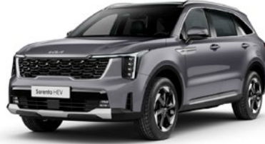
Metal Gri (KLG)