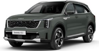
Cityscape Yeşil (CGE)