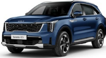
Mineral Mavi (M4B)