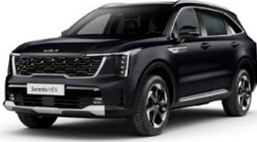
İnci Siyah (ABP)