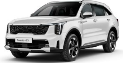
İnci Beyaz (SWP)