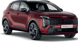
Magma Kırmızı (ARD)