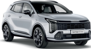
İnci Beyaz (HW2)