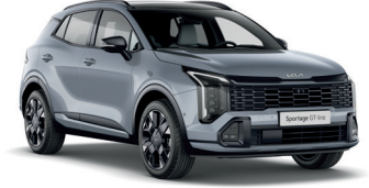
Aytaşı Gri (CSS)