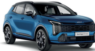
Gökyüzü Mavi (B3L)

Distribütör firma, önceden bildirmeksizin model, teknik özellik, ekipman ve aksesuar değişikliği yapma hakkını saklı tutar. Bu doküman basım tarihinden sonra güncellenmiş olabilir. Kullanılan görsel, mevcut araçtan farklılık gösterebilir. Bu broşürde yer alan bazı özellikler standart modelde bulunmayabilir. Araçla ilgili teknik veriler, homologasyon test raporu, kullanım kılavuzu, bakım kitapçığı ve üretici firma broşürlerinden alınmıştır. Testlerde kullanılan araçlar standart donanımlıdır; opsiyonel donanım ve aksesuarlar, jantlar ve lastikler yakıt tüketimini etkileyebilir. Kia binek aracınız, 2 yıl ya da 60.000 km yasal garanti kapsamındadır. Anahtar teslim tarihinden itibaren, aracınız toplamda 5 yıl veya 150.000 km boyunca Kia Özel Garanti Onarım Güvencesi ile güvence altına alınmaktadır. (AB) 2020/740 yönetmeliği kapsamında, lastiklerin yakıt verimliliği ve diğer parametrelerine ilişkin bilgiler web sitemizde yer almaktadır. Detaylı bilgi için www.kia.com.tr adresini ziyaret edebilirsiniz. Belirtilen lastiklerle ilgili bilgiler yalnızca bilgi amaçlıdır. Tabloda belirtilen donanım özellikleri 2025 model yılı ve Ocak 2026 tarihinden itibaren satışa sunulan araçlar için geçerlidir. Basım hatalarından distribütör firma sorumlu değildir.