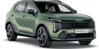
Experience Yeşil (EXG)