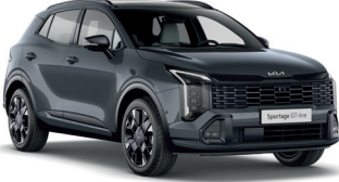
Fırtına Gri (H8G)